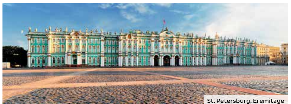
St. Petersburg, Eremitage