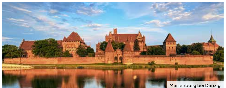
Marienburg bei Danzig

Am Zarenhof Russlands waren im 16. Jahrhundert portugiesische Goldmünzen im Umlauf. Sie wurden so hoch geschätzt, dass Iwan der Schreckliche sie als militärische Verdienstorden an seine tapfersten Kämpfer verlieh.